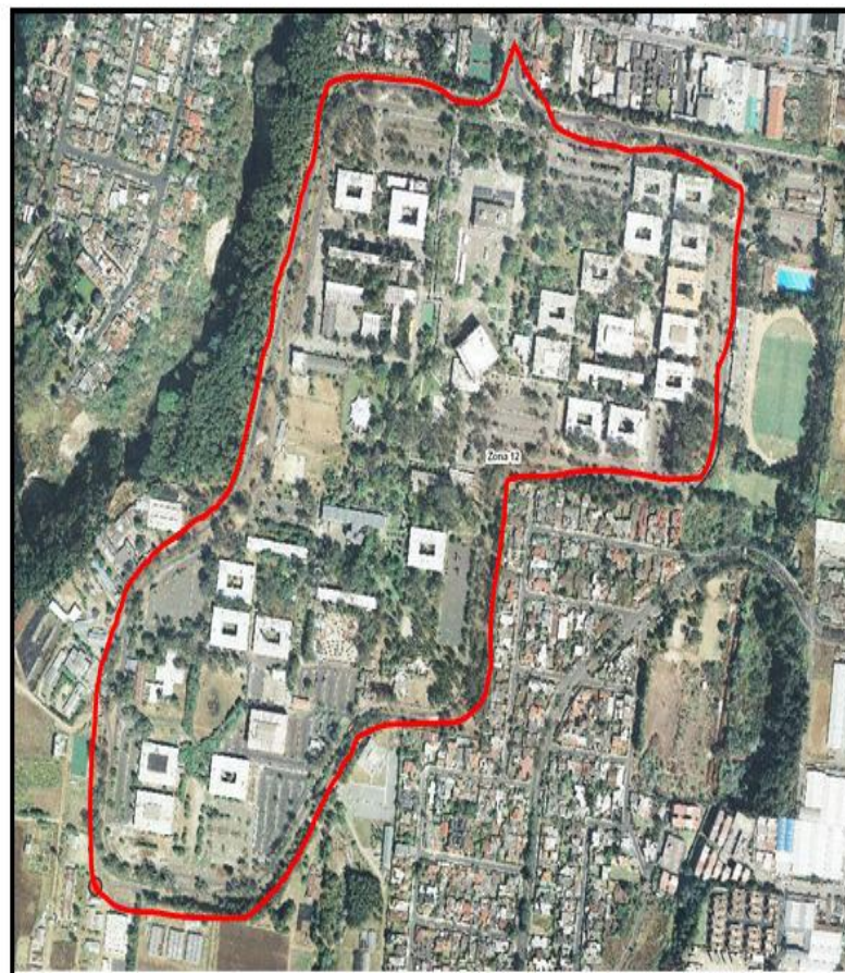
Imagen 1: satelital ( https://sig.muniguate.com/proyectosDIGM/geolocalizador/ )